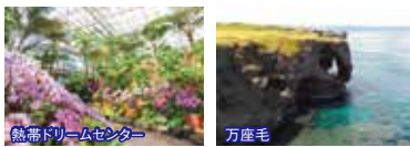
熱帯ドリームセンター

8:35集合 県庁前パレットくもじ(ニッポンレンタカー前) 9:05集合 おもろまちTギャラリア(洋服の青山側)