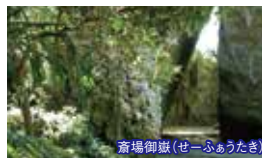
斎場御嶽(せーふあうたき)

料金に含まれるもの / ガイド料(2か所)、おきなわワールド(フリーパス券)入場料、昼食代、保険