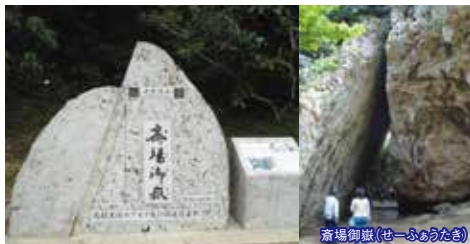
斎場御嶽(せーふあうたき)