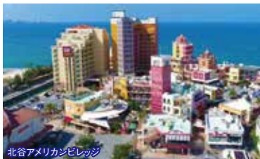
北谷アメリカンビレッジ

8:35集合 県庁前パレットくもじ(ニッポンレンタカー前) 9:05集合 おもろまちTギャラリア(洋服の青山側)