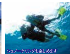
シュノーケリングも楽しめます