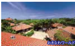
おきなわワールド

※最少催行人数はホテル送迎付の場合となります。お1名様からのアクティビティのご予約も承っております。